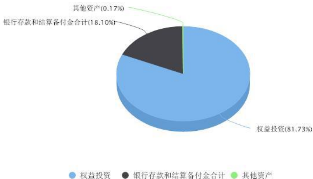
投资组合资产配置图表 数据截止日期:2025年09月30日