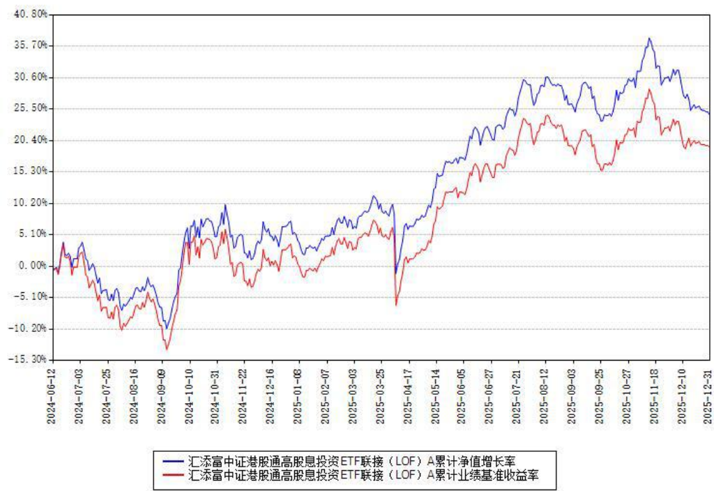
汇添富中证港股通高股息投资ETF联接（LOF）A累计净值增长率与同期业绩基准收益率对比图