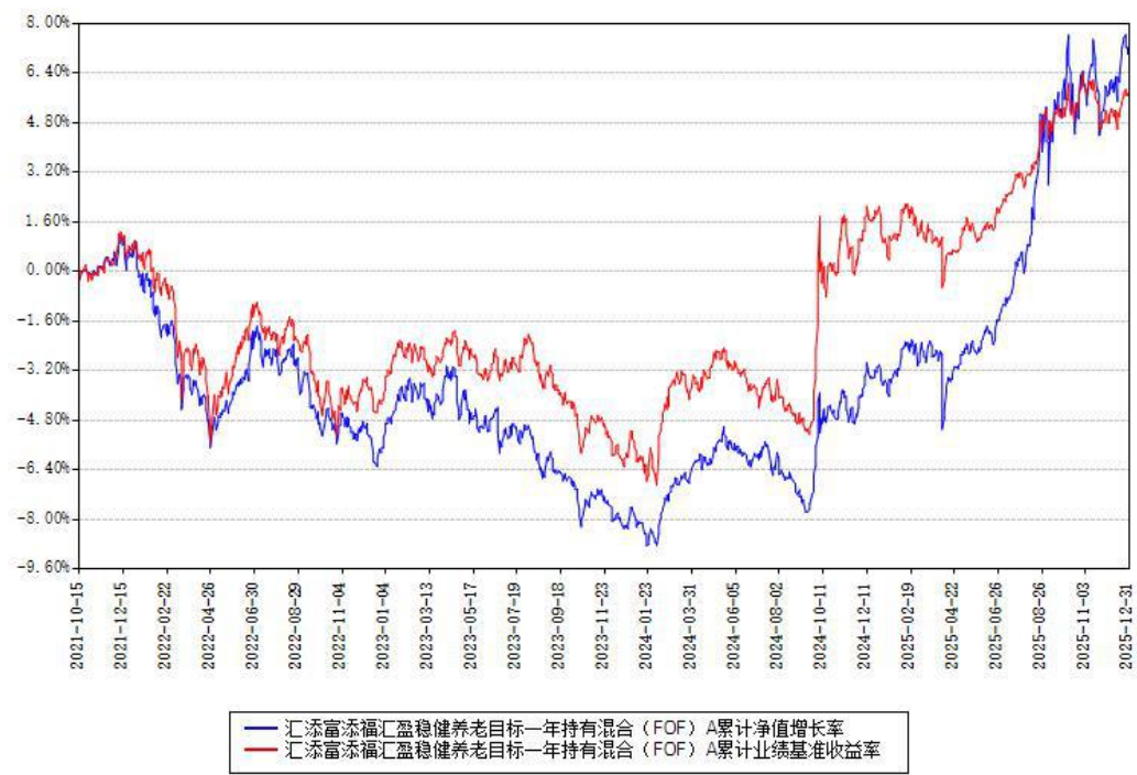
汇添富添福汇盈稳健养老目标一年持有混合（FOF）A 累计净值增长率与同期业绩基准收益率对比图