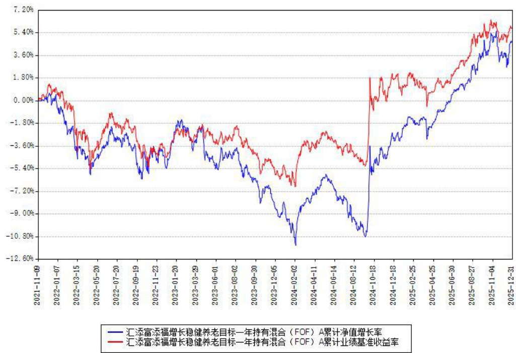
汇添富添福增长稳健养老目标一年持有混合（FOF）A 累计净值增长率与同期业绩基准收益率对比图