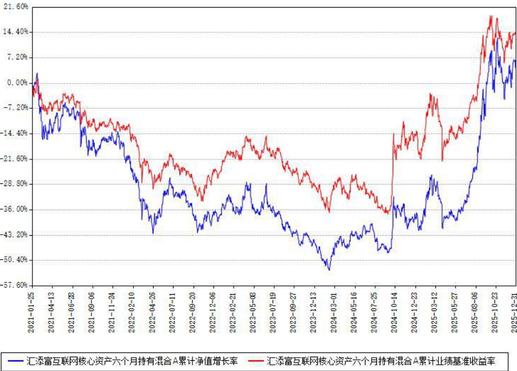
汇添富互联网核心资产六个月持有混合A累计净值增长率与同期业绩基准收益率对比图