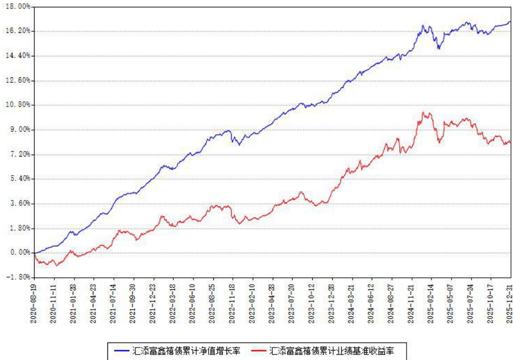
汇添富鑫禧债累计净值增长率与同期业绩基准收益率对比图

注：本基金建仓期为本《基金合同》生效之日（2020年08月19日）起6个月，建仓期结束时各项资产配置比例符合合同约定。