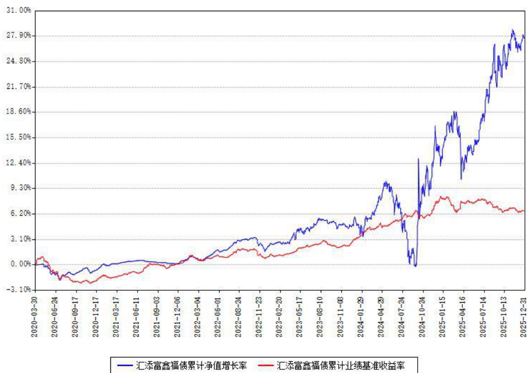
汇添富鑫福债累计净值增长率与同期业绩基准收益率对比图

注：本基金建仓期为本《基金合同》生效之日（2020年03月30日）起6个月，建仓期结束时各项资产配置比例符合合同约定。