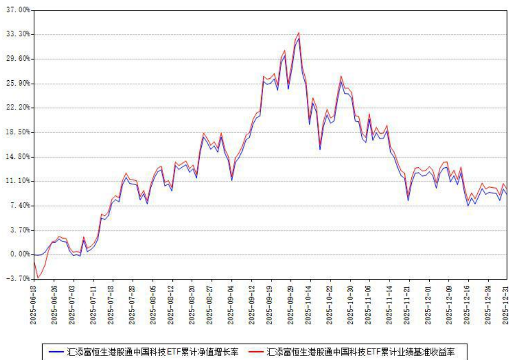
汇添富恒生港股通中国科技ETF累计净值增长率与同期业绩基准收益率对比图

注：本《基金合同》生效之日为 2025 年 06 月 18 日，截至本报告期末，基金成立未满一年。本基金建仓期为本《基金合同》生效之日起 6 个月，截至本报告期末，本基金已完成建仓，建仓期结束时各项资产配置比例符合合同约定。