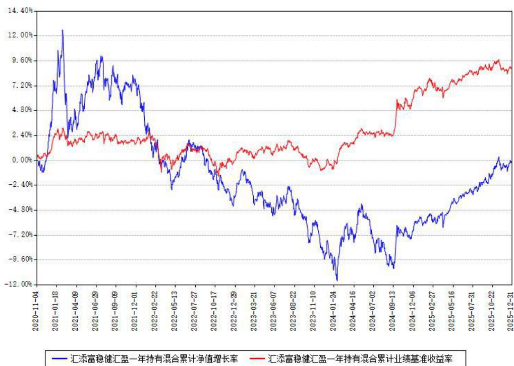
汇添富稳健汇盈一年持有混合累计净值增长率与同期业绩基准收益率对比图

注：本基金建仓期为本《基金合同》生效之日（2020年11月04日）起6个月，建仓期结束时各项资产配置比例符合合同约定。