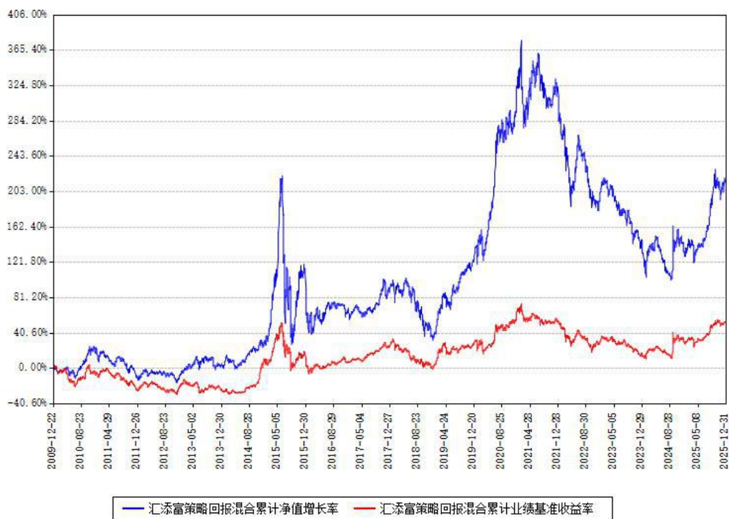
汇添富策略回报混合累计净值增长率与同期业绩基准收益率对比图

注：本基金建仓期为本《基金合同》生效之日（2009年12月22日）起6个月，建仓期结束时各项资产配置比例符合合同约定。