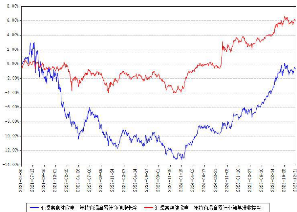
汇添富稳健欣享一年持有混合累计净值增长率与同期业绩基准收益率对比图

注：本基金建仓期为本《基金合同》生效之日（2021年04月30日）起6个月，建仓期结束时各项资产配置比例符合合同约定。