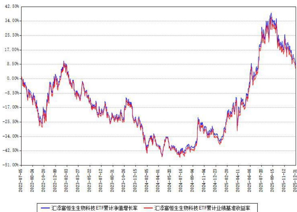
汇添富恒生生物科技ETF累计净值增长率与同期业绩基准收益率对比图

注：本基金建仓期为本《基金合同》生效之日（2022年07月05日）起6个月，建仓期结束时各项资产配置比例符合合同约定。