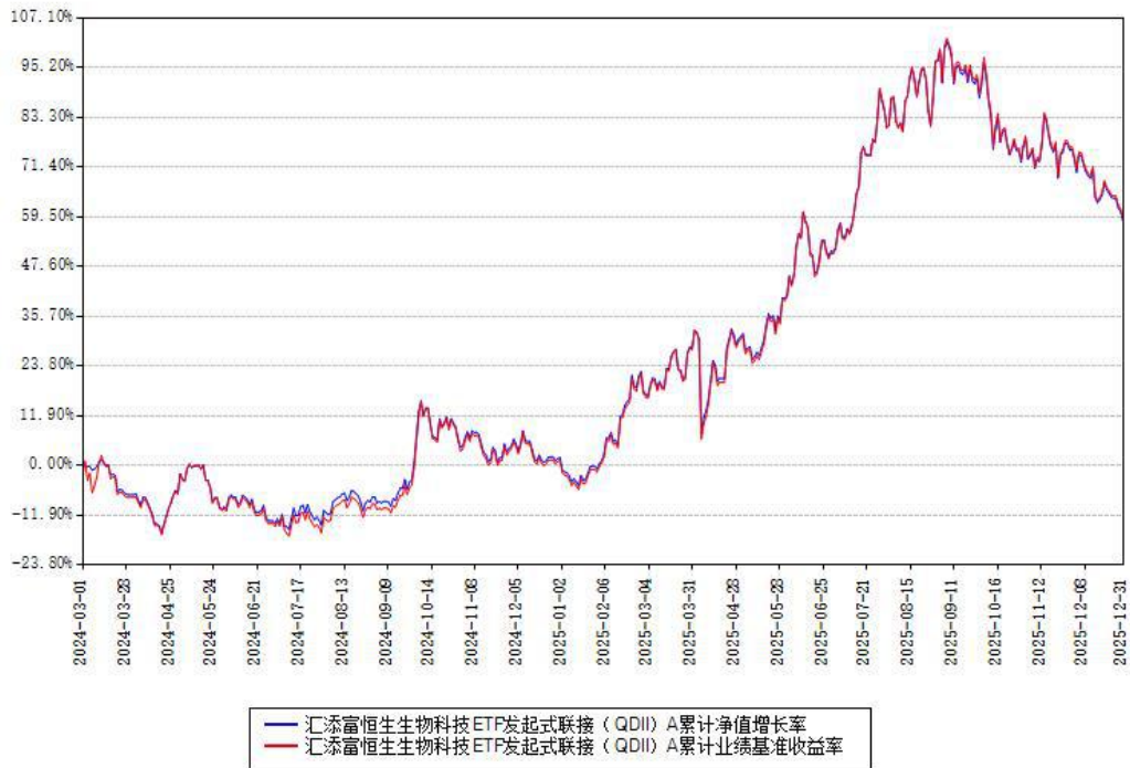
汇添富恒生生物科技ETF发起式联接 (QDII) A 累计净值增长率与同期业绩基准收益率对比图