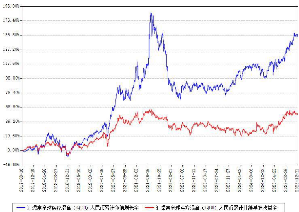
汇添富全球医疗混合（QDII）人民币累计净值增长率与同期业绩基准收益率对比图