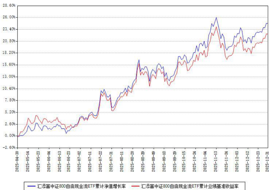
汇添富中证800自由现金流ETF累计净值增长率与同期业绩基准收益率对比图

注：本《基金合同》生效之日为 2025 年 04 月 30 日，截至本报告期末，基金成立未满一年。本基金建仓期为本《基金合同》生效之日起 6 个月，截至本报告期末，本基金已完成建仓，建仓期结束时各项资产配置比例符合合同约定。