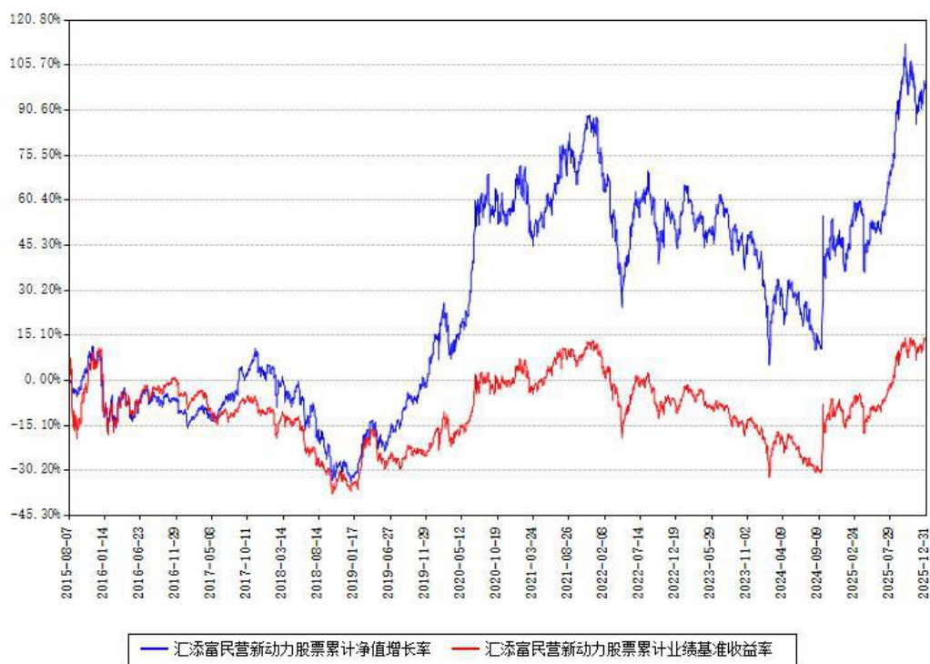
汇添富民营新动力股票累计净值增长率与同期业绩基准收益率对比图

注：本基金建仓期为本《基金合同》生效之日（2015年08月07日）起6个月，建仓期结束时各项资产配置比例符合合同约定。