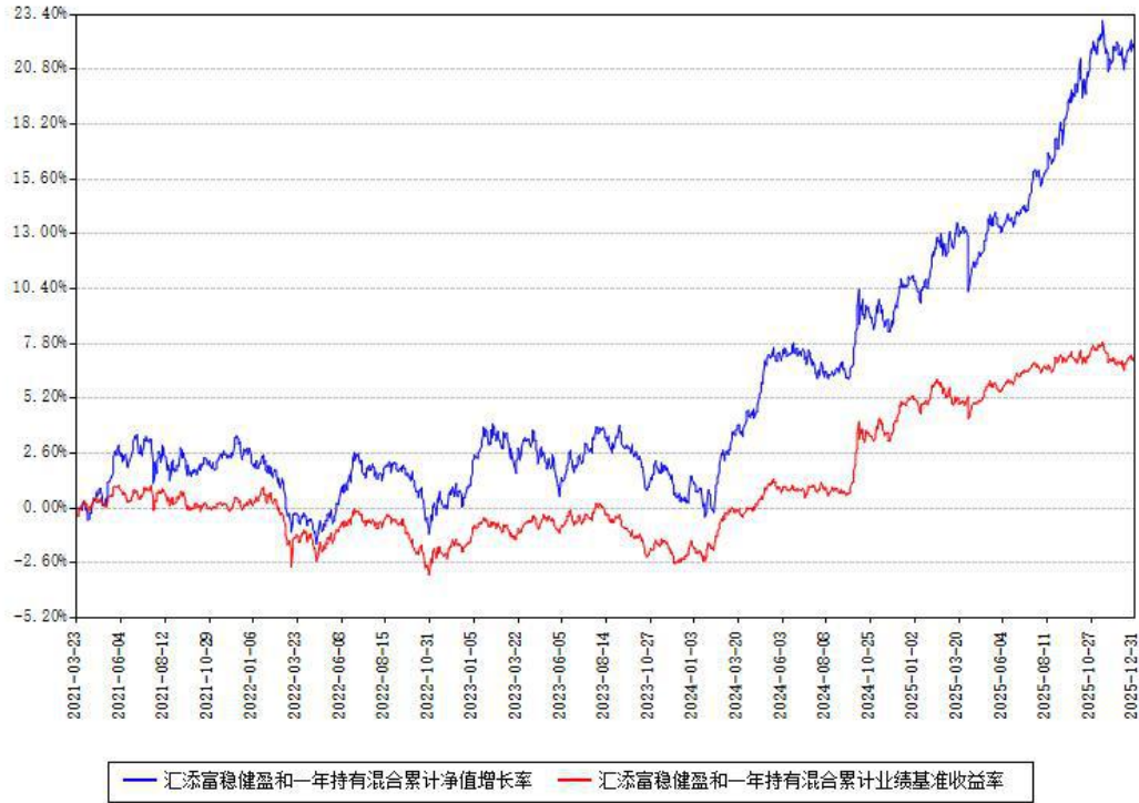
汇添富稳健盈和一年持有混合累计净值增长率与同期业绩基准收益率对比图

注：本基金建仓期为本《基金合同》生效之日（2021年03月23日）起6个月，建仓期结束时各项资产配置比例符合合同约定。