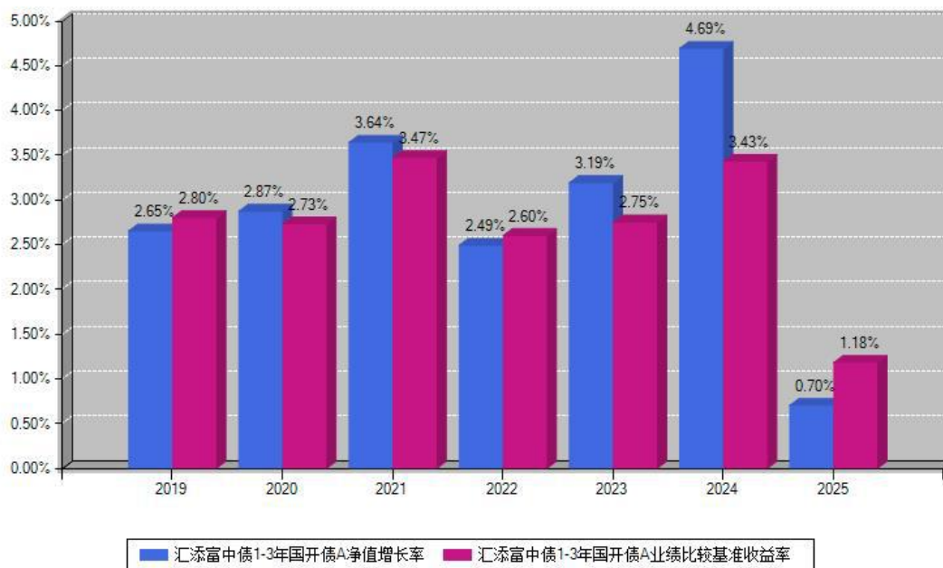
汇添富中债1-3年国开债A每年净值增长率与同期业绩基准收益率对比图

注：数据截止日期为2025年12月31日，基金的过往业绩不代表未来表现。本《基金合同》生效之日为2019年04月15日，合同生效当年按实际存续期计算，不按整个自然年度进行折算。