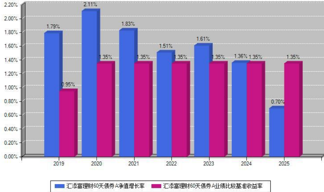
汇添富理财60天债券A每年净值增长率与同期业绩基准收益率对比图

注：数据截止日期为2025年12月31日，基金的过往业绩不代表未来表现。本《基金合同》生效之日为2019年04月18日，合同生效当年按实际存续期计算，不按整个自然年度进行折算。