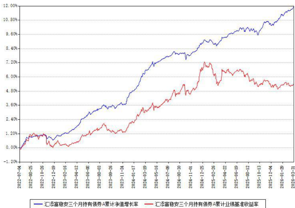
汇添富稳安三个月持有债券A累计净值增长率与同期业绩基准收益率对比图