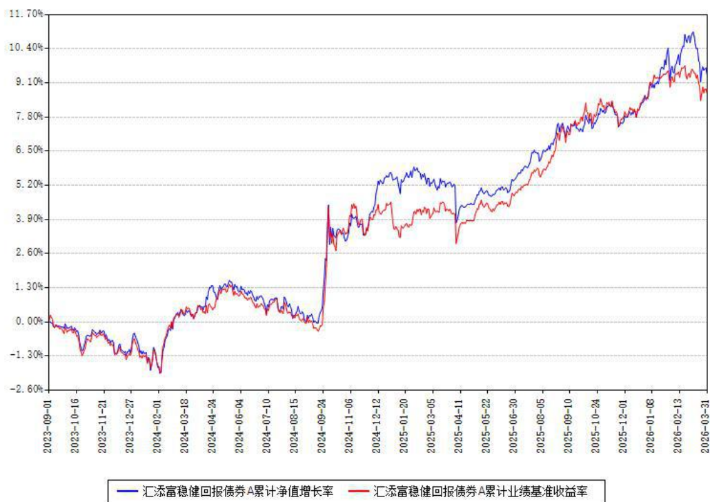
汇添富稳健回报债券A累计净值增长率与同期业绩基准收益率对比图