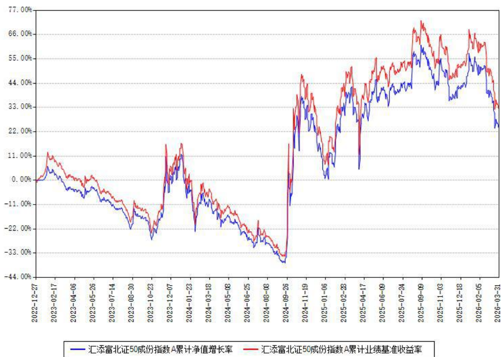
汇添富北证50成份指数A累计净值增长率与同期业绩基准收益率对比图