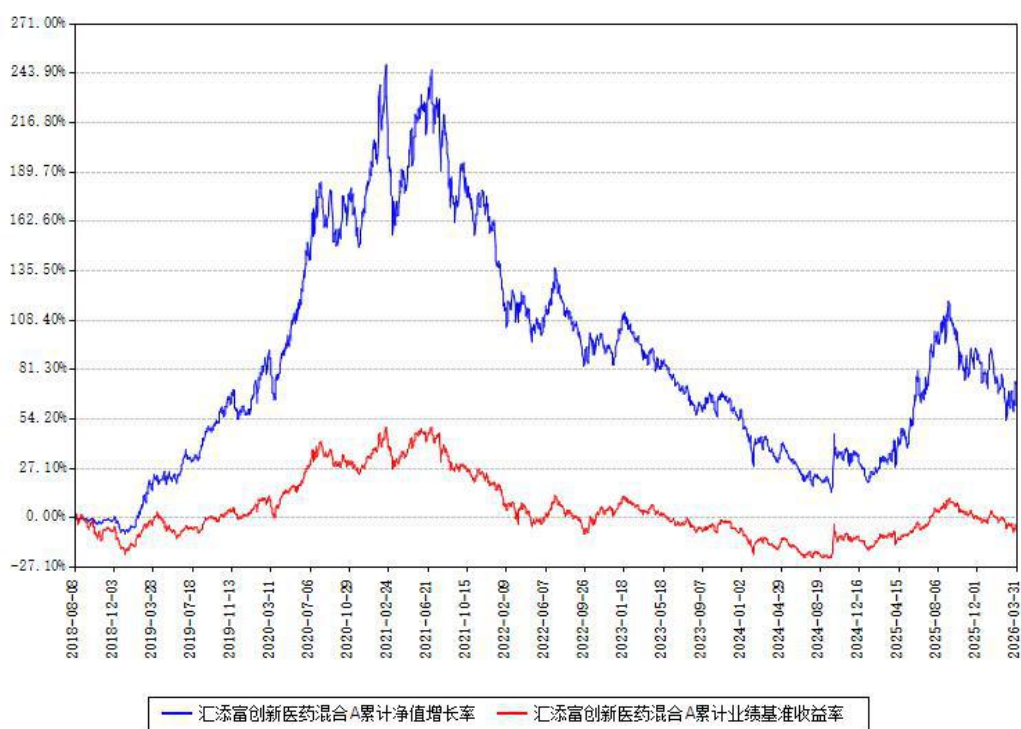
汇添富创新医药混合A累计净值增长率与同期业绩基准收益率对比图