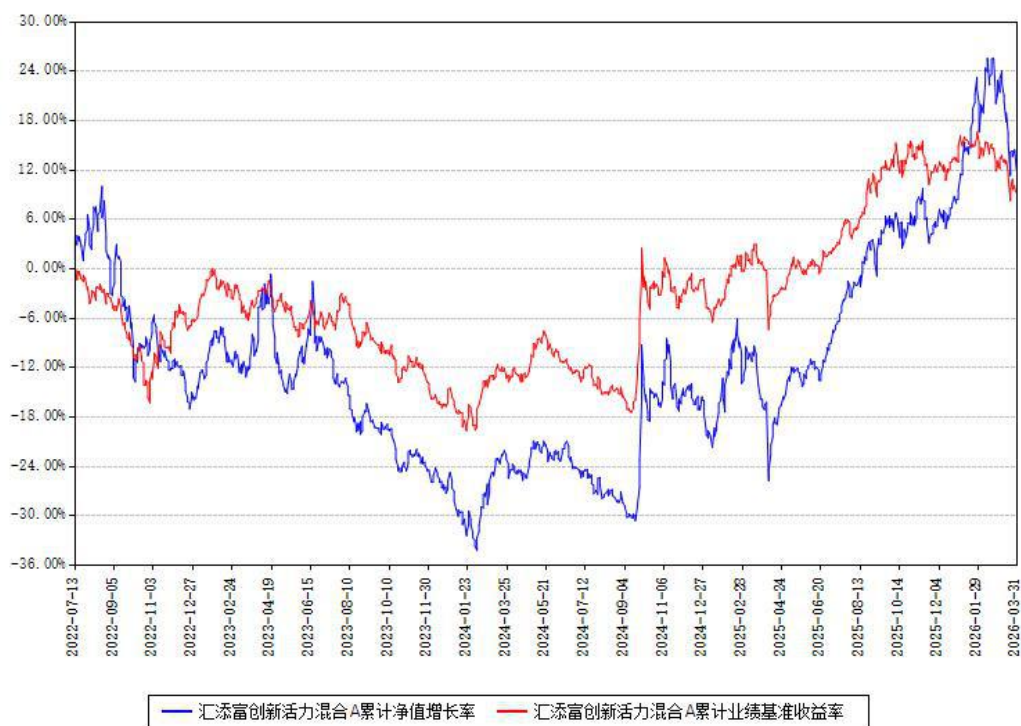
汇添富创新活力混合A累计净值增长率与同期业绩基准收益率对比图