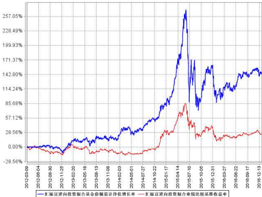
汇添富逆向投资混合基金份额累计净值增长率与同期业绩比较基准收益率的历史走势对比图

注：本基金建仓期为本《基金合同》生效之日(2012年3月9日)起6个月，建仓期结束时各项资产配置比例符合合同规定。