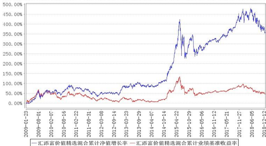
汇添富价值精选混合累计净值增长率与同期业绩比较基准收益率的历史走势对比图

注:本基金建仓期为本《基金合同》生效之日(2009年1月23日)起6个月,建仓期结束时各项资产配置比例符合合同规定。