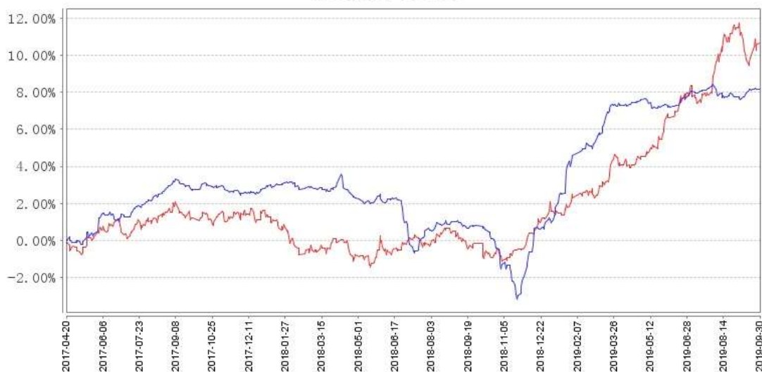
— 汇添富美元债券(QDII)美元现汇A累计净值增长率 — 汇添富美元债券(QDII)美元现汇A累计业绩基准收益率