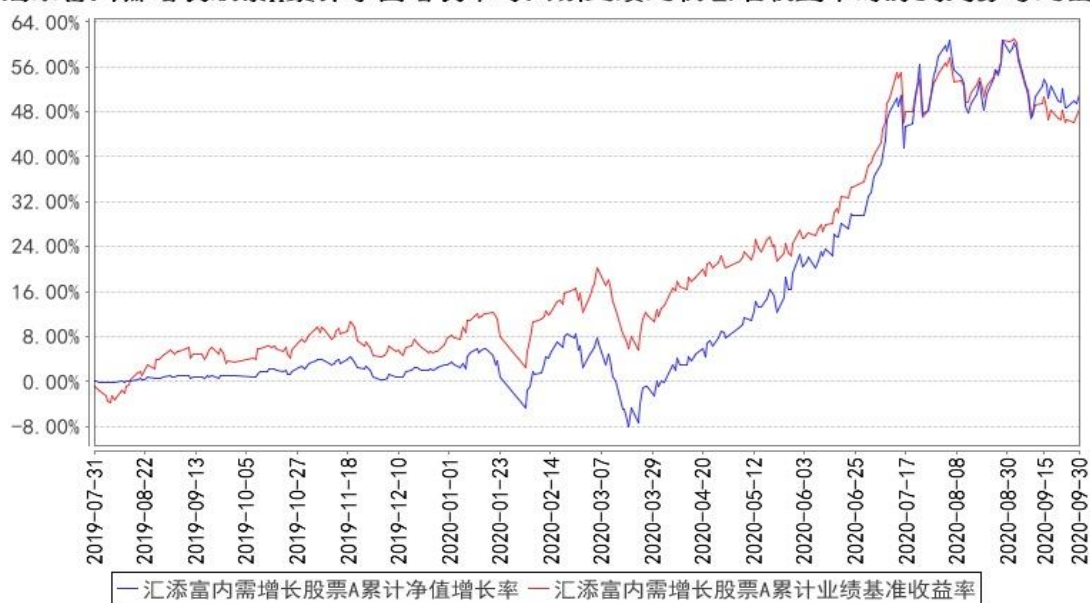
汇添富内需增长股票A累计净值增长率与同期业绩比较基准收益率的历史走势对比图