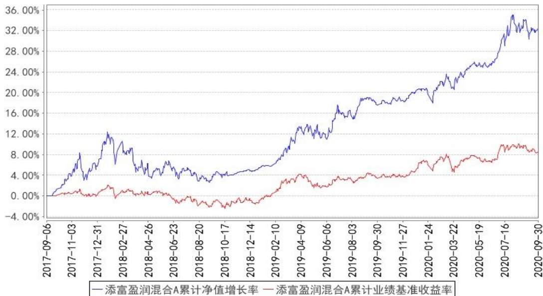
添富盈润混合A累计净值增长率与同期业绩比较基准收益率的历史走势对比图