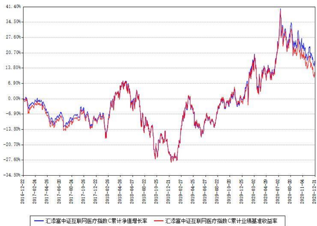
汇添富中证互联网医疗指数C累计净值增长率与同期业绩基准收益率对比图