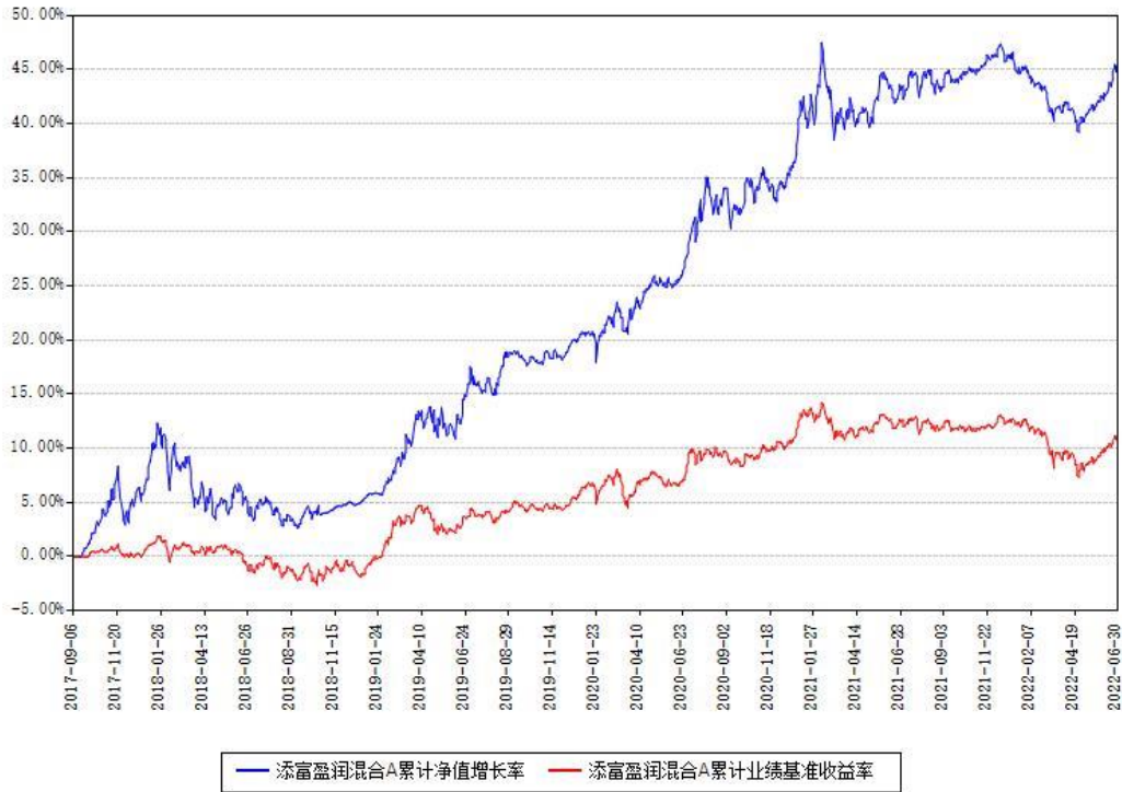
添富盈润混合A累计净值增长率与同期业绩基准收益率对比图

(二) 自基金合同生效以来基金累计净值增长率变动及其与同期业绩比较基准收益率变动的比较图