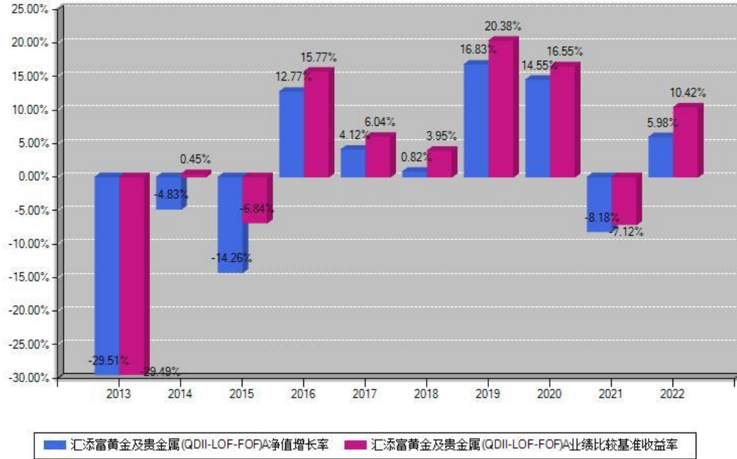
汇添富黄金及贵金属(QDII-LOF-FOF)A每年净值增长率与同期业绩基准收益率对比图

注：基金的过往业绩不代表未来表现。本《基金合同》生效之日为2011年08月31日，合同生效当年按实际存续期计算，不按整个自然年度进行折算。