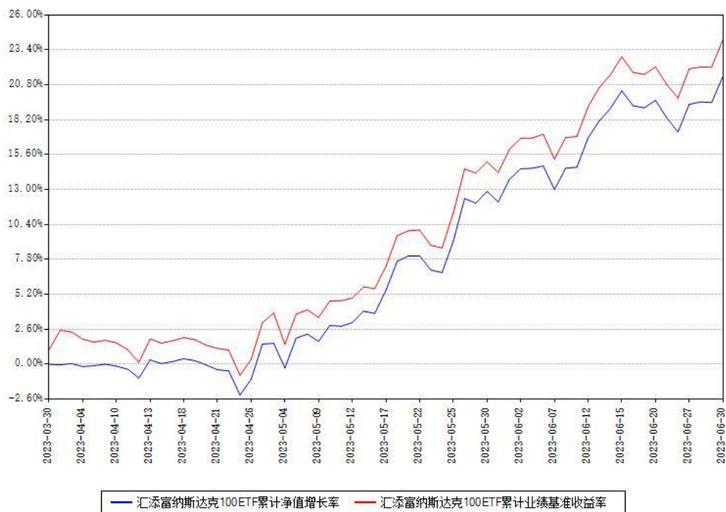
汇添富纳斯达克100ETF累计净值增长率与同期业绩基准收益率对比图