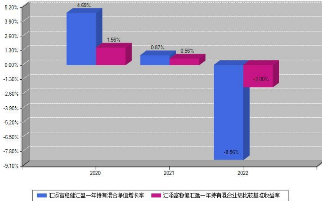
汇添富稳健汇盈一年持有混合每年净值增长率与同期业绩基准收益率对比图

注：基金的过往业绩不代表未来表现。本《基金合同》生效之日为2020年11月04日，合同生效当年按实际存续期计算，不按整个自然年度进行折算。