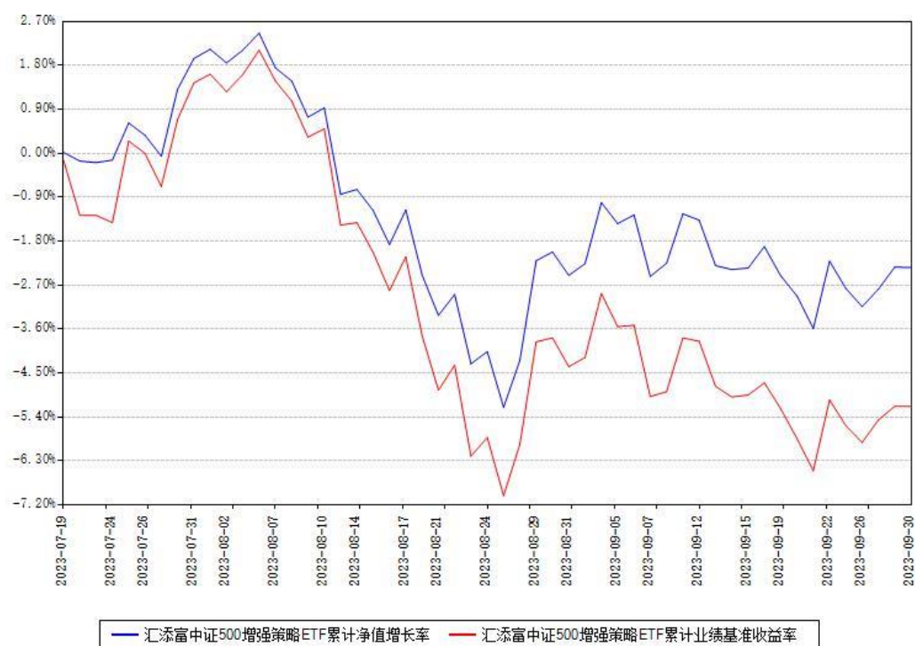
汇添富中证500增强策略ETF累计净值增长率与同期业绩基准收益率对比图

(二) 自基金合同生效以来基金累计净值增长率变动及其与同期业绩比较基准收益率变动的比较图