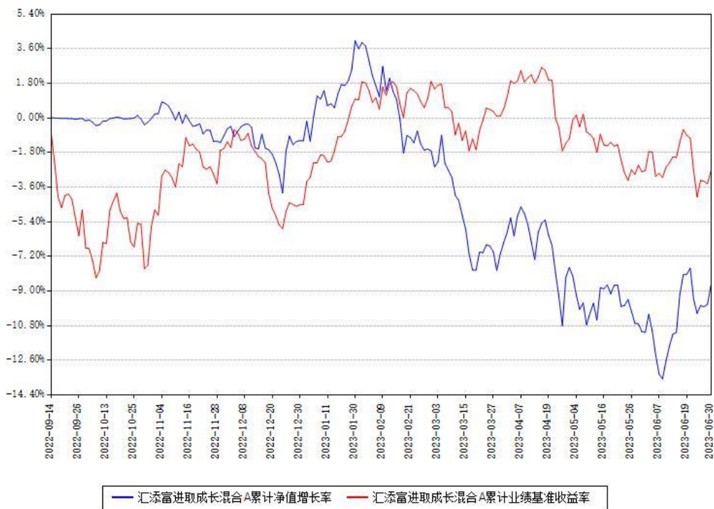
汇添富进取成长混合A累计净值增长率与同期业绩基准收益率对比图