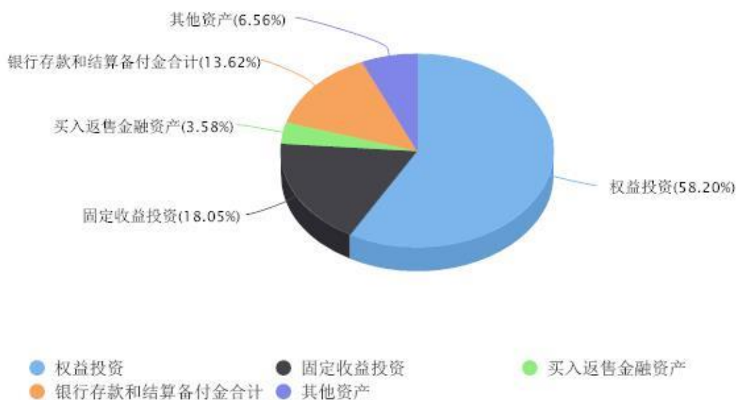
投资组合资产配置图表 数据截止日期:2023年12月31日