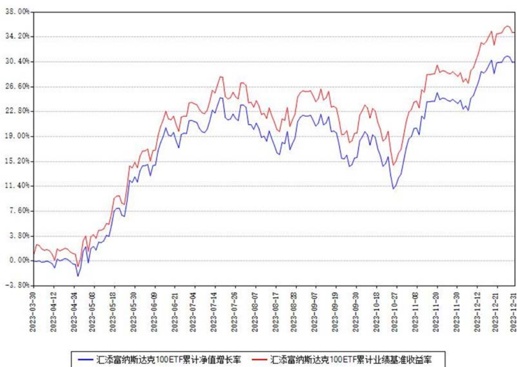
汇添富纳斯达克100ETF累计净值增长率与同期业绩基准收益率对比图