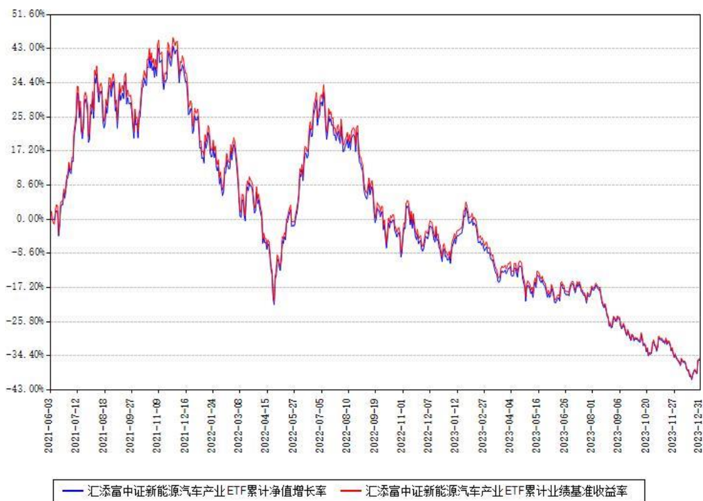
汇添富中证新能源汽车产业ETF累计净值增长率与同期业绩基准收益率对比图

注：本基金建仓期为本《基金合同》生效之日（2021年06月03日）起6个月，建仓期结束时各项资产配置比例符合合同约定。