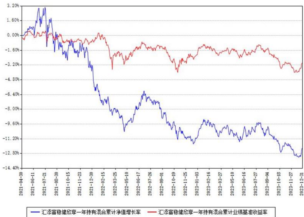
汇添富稳健欣享一年持有混合累计净值增长率与同期业绩基准收益率对比图