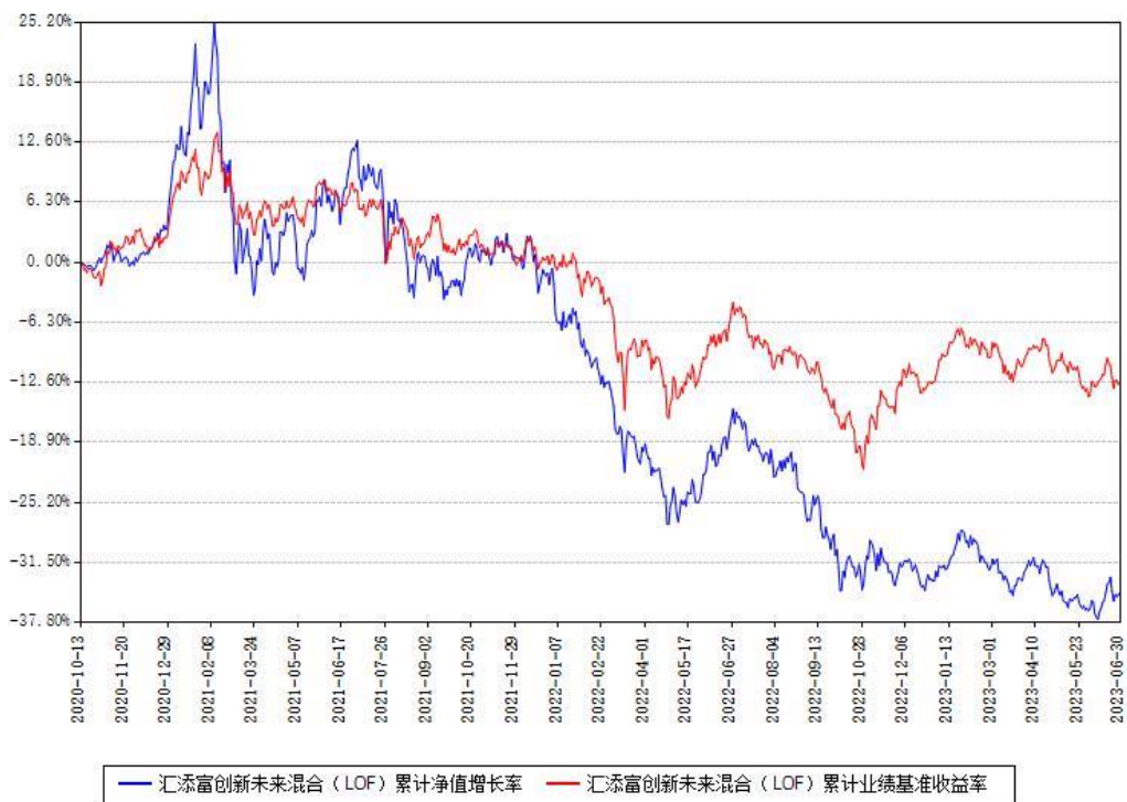
汇添富创新未来混合（LOF）累计净值增长率与同期业绩基准收益率对比图