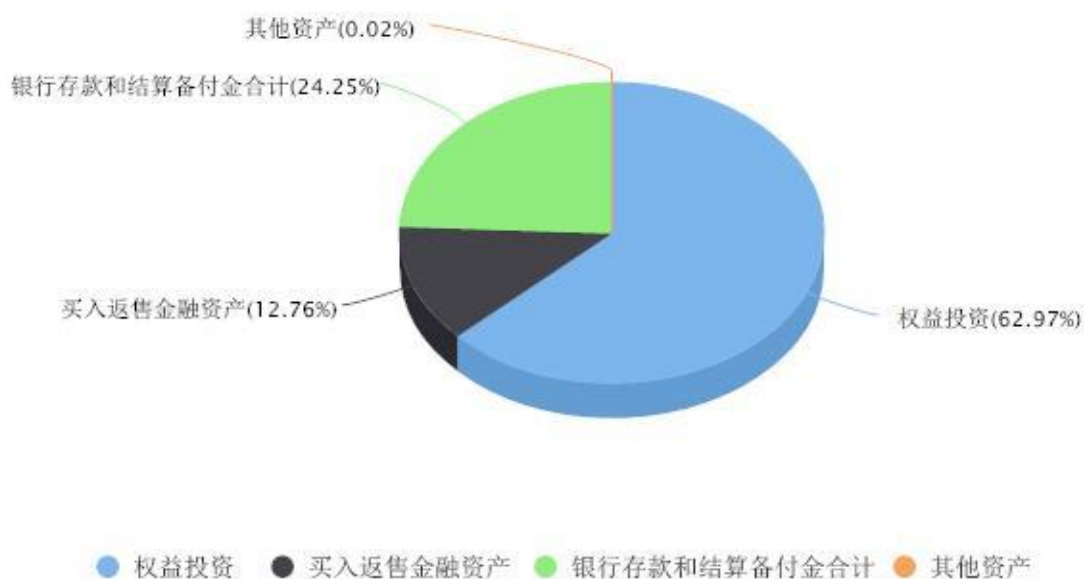
投资组合资产配置图表 数据截止日期:2023年09月30日