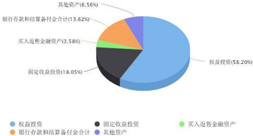
投资组合资产配置图表 数据截止日期:2023年12月31日