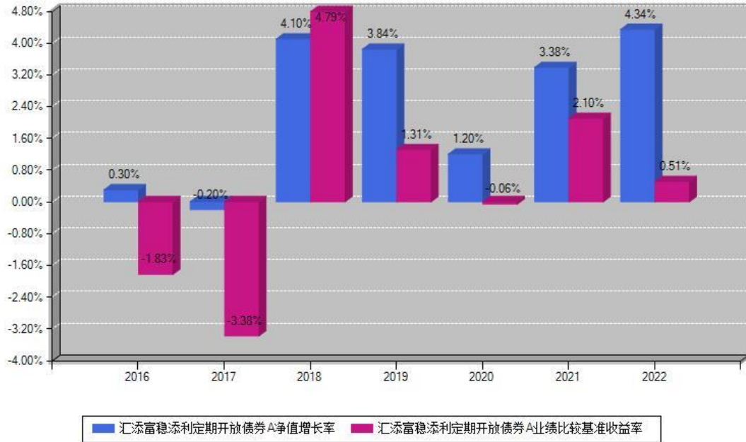
汇添富稳添利定期开放债券A每年净值增长率与同期业绩基准收益率对比图

注：数据截止日期为2022年12月31日，基金的过往业绩不代表未来表现。本《基金合同》生效之日为2016年03月16日，合同生效当年按实际存续期计算，不按整个自然年度进行折算。