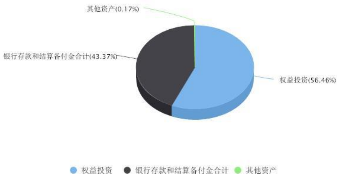
投资组合资产配置图表 数据截止日期:2023年09月30日