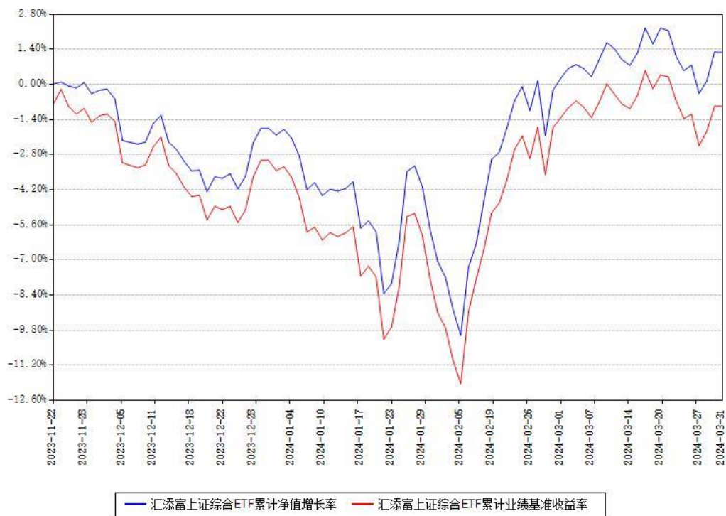
汇添富上证综合ETF累计净值增长率与同期业绩基准收益率对比图