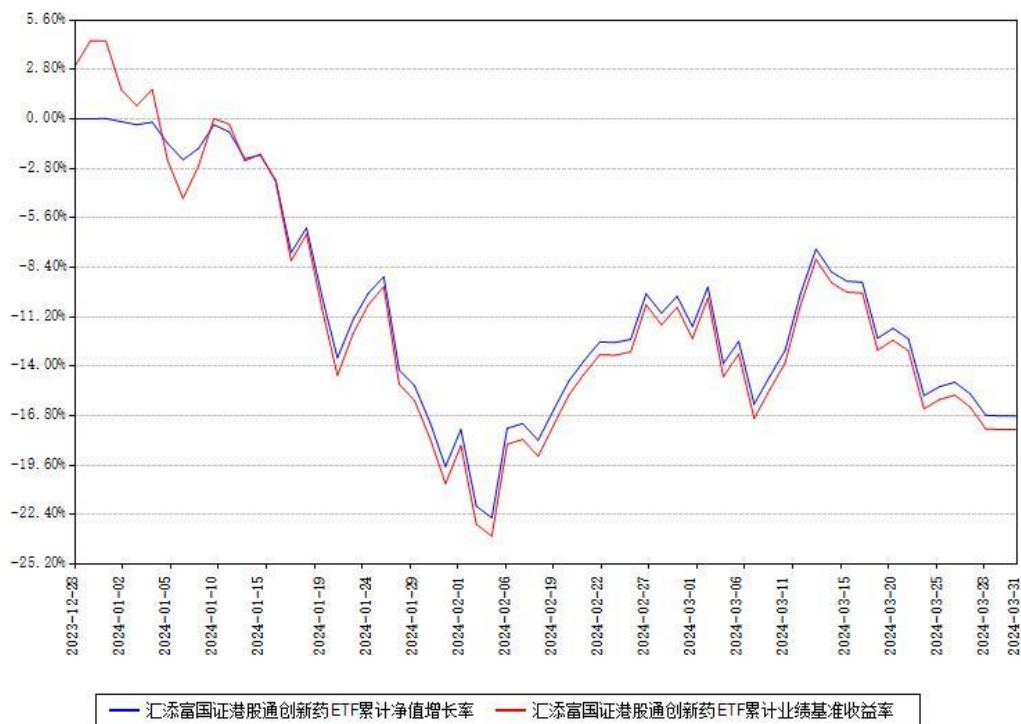
汇添富国证港股通创新药ETF累计净值增长率与同期业绩基准收益率对比图