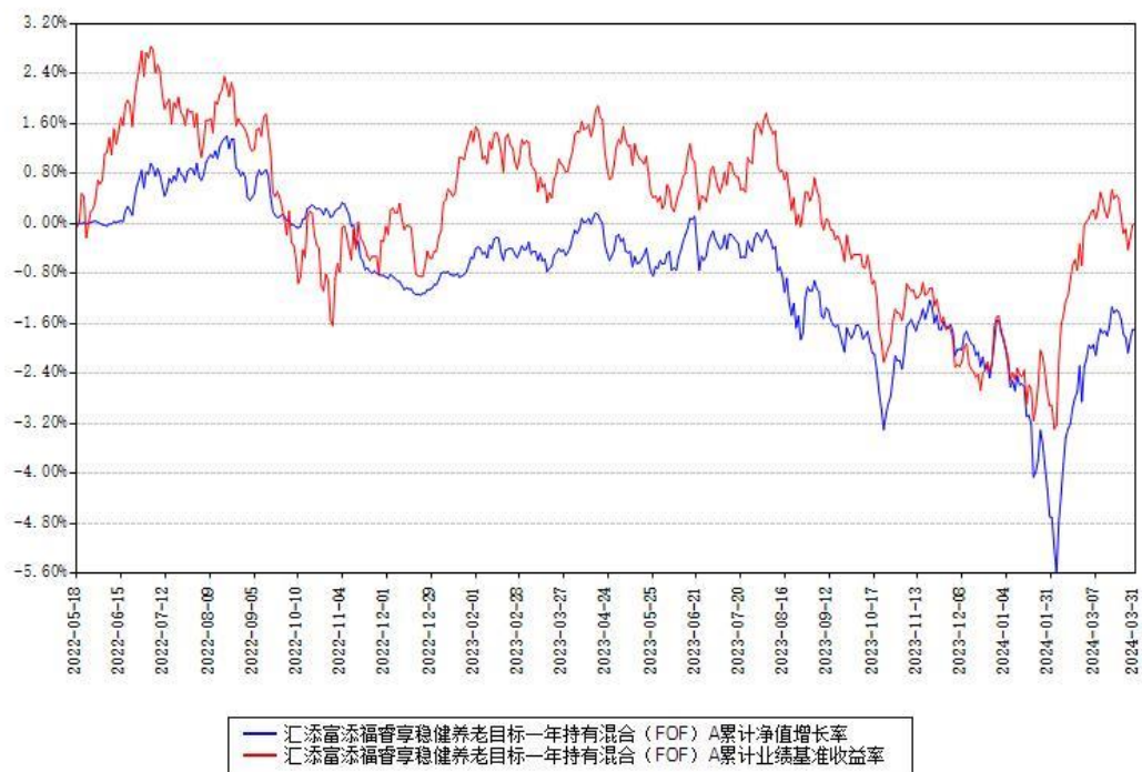
汇添富添福睿享稳健养老目标一年持有混合 (FOF) A 累计净值增长率与同期业绩基准收益率对比图