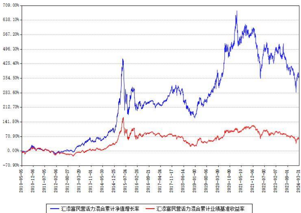
汇添富民营活力混合累计净值增长率与同期业绩基准收益率对比图

(二)自基金合同生效以来基金累计净值增长率变动及其与同期业绩比较基准收益率变动的比较图