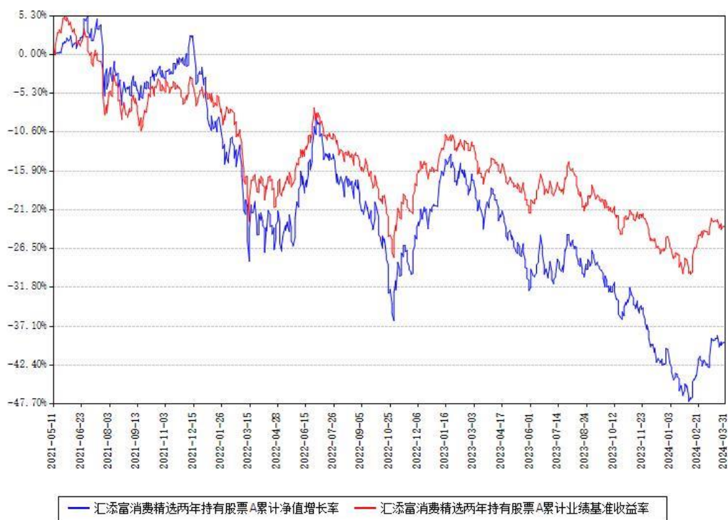
汇添富消费精选两年持有股票A累计净值增长率与同期业绩基准收益率对比图